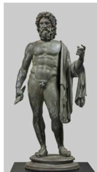
des sculptures (des statues)

Au musée, vous pouvez voir beaucoup d'objets anciens :