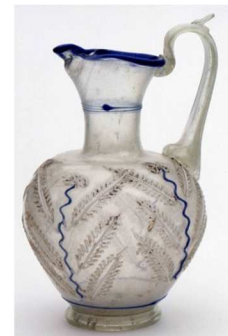
de la vaisselle