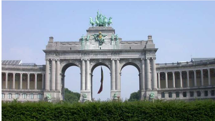
Le Parc du Cinquantenaire avec les arcades

Au musée, vous pouvez voir beaucoup d'objets anciens :