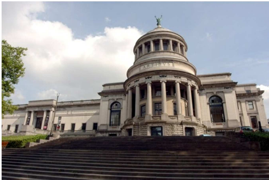
Le Musée du Cinquantenaire

Le Musée du Cinquantenaire se trouve à Bruxelles. Il porte ce nom car il se trouve dans le parc du Cinquantenaire. C'est l'un des plus grands musées de Belgique. C'est un musée très ancien.